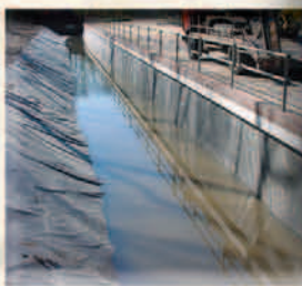
Waterbekkens en projecten voor Rijkswaterstaat