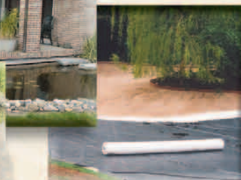
Parken: De Efteling, Kronenburgpark, Urk, Japanse Watertuin