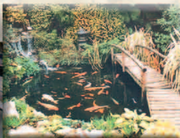
Internationale beurzen: Koi-beurs, Aqua-expo...