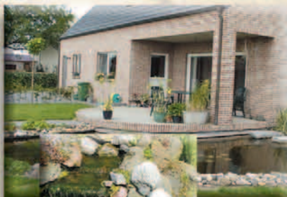
Tuinvijvers & waterpartijen